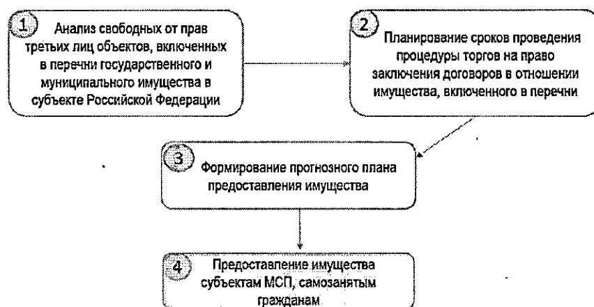
Рисунок 2. Примерная схема формирования прогнозного плана предоставления имущества

9.5. Примерная схема формирования прогнозного плана предоставления имущества отражена на рисунке 2.